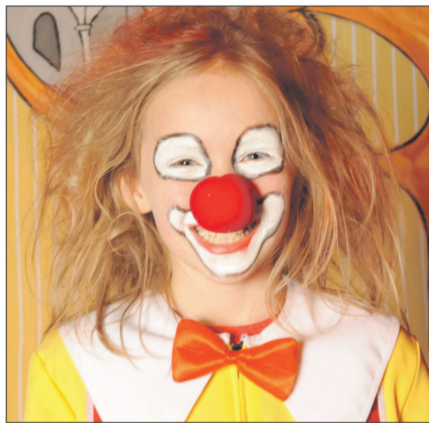
Wer hat das schönste Kostüm? Tolle Preise für die besten Verkleidungen gibt's beim Kinderfaschingsball von Moni & Patrik in der Reithalle.

München · Am Sonntag, 8. Februar, von 14 bis 19 Uhr präsentieren Moni schingsball.de. Karten gibt's bei allen bekannten Münchner Vorverkaufsstellen.